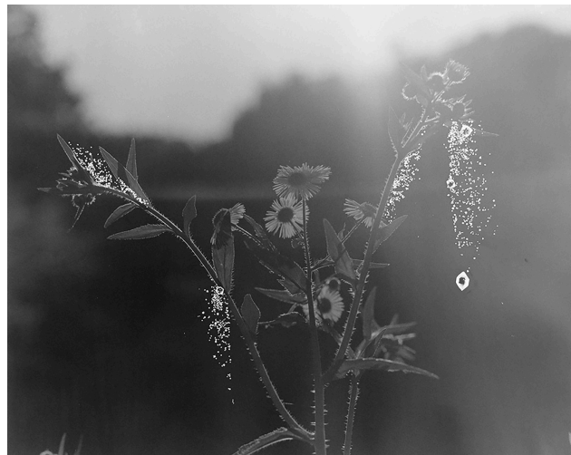
(右)《Crystal Photographs#20-1 星の器 No.1》508×610mm, Gelatin silver print, Unique, 2024

https://drive.google.com/drive/folders/1wVwryOhqGxtcNso5EOCsD2R9yJ4Vlt8X?usp=sharing