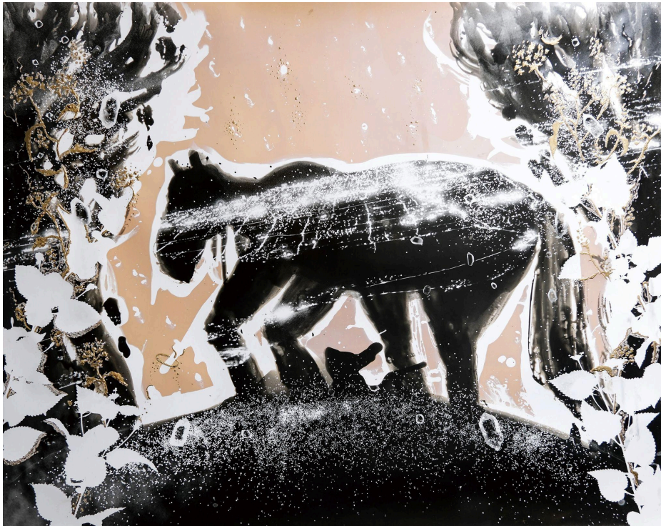
《Solaris Lux#38 遠くの島と No.1》803×1000mm, Gelatin silver print, synthetic urushi, gold brass powder, Unique, 2025