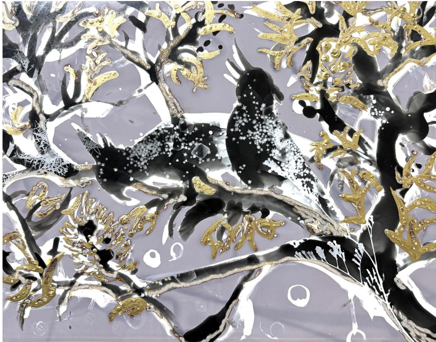
《Solaris Lux#28 花鳥星 No.1》193×244mm, Gelatin silver print, synthetic urushi, gold brass powder, Unique, 2025

2025年、二冊の本と出会いました。その出会いをきっかけに、瞼の裏にひとつの景色が生まれました。大きな循環のようなものを、光で描きたいと願っています。1年ぶり4回目の東京個展です。お時間がいただけたら、ぜひご覧下さい。